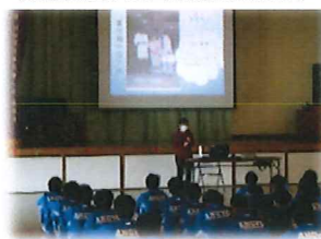
(助産師による出前授業の様子)